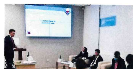
Заседание аттестационной комиссии Минобрнауки Адыгеи, октябрь 2020 года