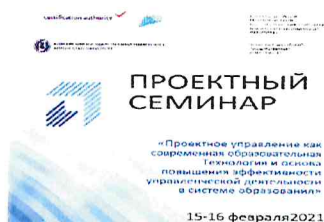
Проектный семинар для руководителей и заместителей руководителей государственных и муниципальных образовательных организаций Республики Адыгея со стажем работы до 3 лет и лиц, включенных в республиканский резерв руководителей, февраль 2021 года