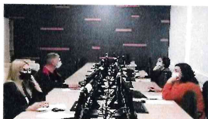
Тестирование кандидатов в рамках отбора по формированию резерва руководителей для замещения вакантных должностей руководителей образовательных организаций, ноябрь 2020 года