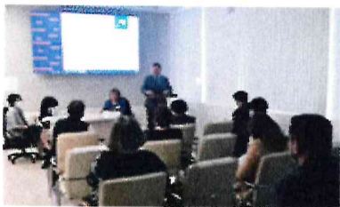
Обучающий семинар для руководителей образовательных организаций, подведомственных Минобрнауки Адыгеи, сентябрь 2020 года