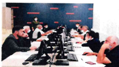
Тестирование руководителей образовательных организаций, подведомственных Минобрнауки Адыгеи в рамках периодической аттестации руководителей, октябрь 2020 года